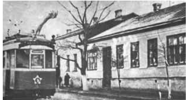
Рис.1. Будівля Волинської земської школи фельдшерів і фельдшериць-акушерок на початку ХХ ст.

Батьки “своєкоштных” вихованців повинні були сплачувати за навчання дітей по 20 крб. на рік. Це була невелика сума, якщо порівняти її з реальними коштами, що йшли на утримання кожного вихованця в рік. Але для селян, збіднілих міщан, з дітей яких і складався контингент вихованців фельдшерської школи, сплата за навчання і утримання дитини в місті часто було неможливим. Саме тому до нашого часу дійшла велика кількість “прошений” на ім’я