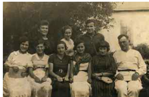
Рис. 11. Випуск, 1938 рік

Життя студентів школи в якійсь мірі ускладнюється. З 1937 року анулюються безкоштовні обіди, скорочується кількість гуртожитків. Більше половини студентів сплачують за своє навчання. На початку 1941 року в школі 121 стипендіат, 3 відмінники, звільнені від сплати за навчання і 22 особи – діти комун і патронатів, пенсіонери, звільнені від платні за навчання за розпорядженням Наркомздоров'я (рис. 11).