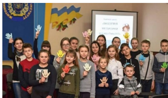
Рис. 39. Заняття в «Академія медицини майбутнього», 2019 р.

В Житомирському медичному інституті створено освітній центр «Академія медицини майбутнього» для учнів 5-9 класів. Тут вони пізнають багато цікавого: історію становлення медицини, медицину сучасності, дивляться світ під мікроскопом, знайомляться з основами стоматології, вивчають англійську мову, уроки вокалу, фітнес (рис. 39).