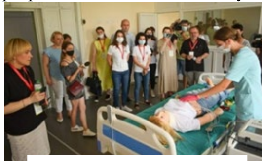
Рис. 34. Відкриття тренінгового центру, 2021 р.

Житомирський медичний інститут, є одним із шести пілотних закладів вищої медичної освіти, бере участь в Україно-швейцарському проєкті «Розвиток медичної освіти в Україні». 25 червня 2021 року за участі і фінансування Україно-швейцарського проєкту на базі інституту відкрито навчально-тренінговий центр площею 800 квадратних метри. В його Структурі є 13 навчальних кімнат, в яких здійснюється практична підготовка здобувачів Закладу (рис. 34).