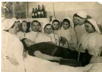
Рис. 17. Практичне заняття з терапії, 1940-і роки