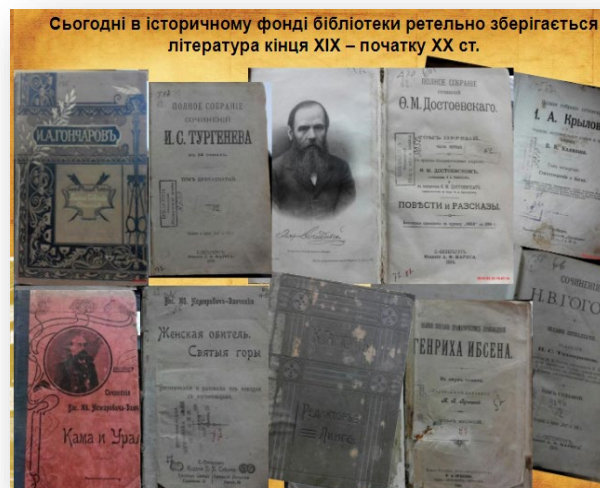
Рис. 5. Виставка бібліотечного архіву

На чолі об’єднаних медшкіл стояв ректор. Цю посаду обіймав Микола Філімонович Лазицький. Він же керував школою лікпомів (рис. 6,7).