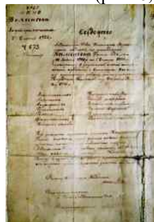
Рис. 7. Свідоцтво про закінчення Волинської акушерської школи, 1922 рік