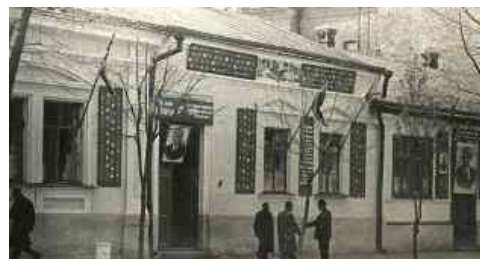
Рис. 19. Житомирське медичне училище, 1960-і роки

А про надзвичайну популярність медичного училища в 60-і роки свідчить те, що на планові 180 місць першого курсу було подано 1187 заяв. Тоді училище готувало спеціалістів наступних профілів: фельдшерів на базі 8 і 10 класів, санітарних фельдшерів на базі 8 класів, акушерок на базі 8 і 10 класів, медсестер на базі 10, 8 класів, зубних техніків на базі 8 класів, зубних лікарів на базі 10 класів (рис. 19).