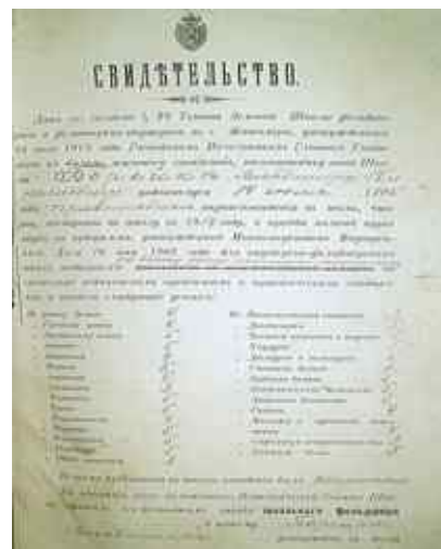
Рис. 3. Свідоцтво про присвоєння звання шкільного фельдшера В. Борейку

У 1913 році в школі було розпочато підготовку шкільних фельдшерів (рис. 3).