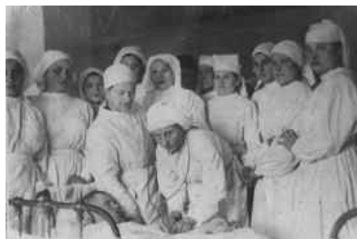
Рис. 13. Робота в польовому шпиталі