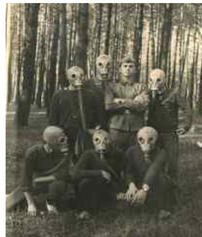
Рис. 10. Заняття з військово-медичної підготовки

На початку тридцятих років новим явищем в житті технікуму була так звана “воєнізація”. Для вивчення «воєнних» предметів, студенти поділялись на бригади, на чолі яких стояли бригадири. Починаючи з цього часу і допочатку Великої Вітчизняної війни, воєнній підготовці студентів технікуму відводиться найважливіше місце в навчальному процесі.