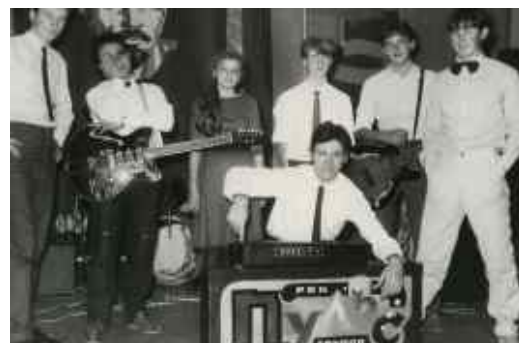
Рис. 23. Ансамбль «Пульс»

В актовій залі медичного училища проводились конкурси: “Анумо, дівчата!”, “Анумо, першокурсник!”, “Анумо, хлопці!”, конкурси квіткових композицій до Дня вчителя (рис. 23).