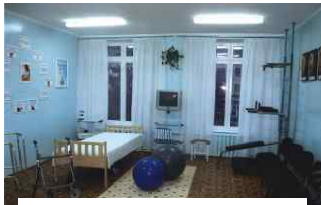
Рис. 28. Тренажерний зал – пологовий кабінет

Проведена робота отримала позитивну оцінку влади, ЗМІ, упорядковані території стали окрасою одного із куточків центральної частини міста.