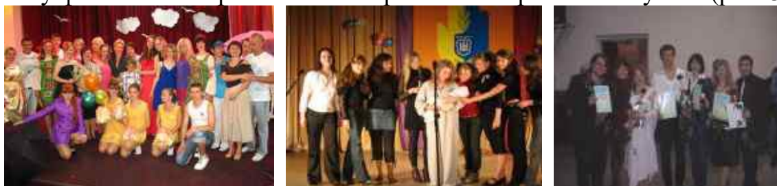
Рис. 37. Учасники інтерактивного театру «Персона»

Учасники інтерактивного театру «Персона» щороку займають призові місця у міському фестивалі інтерактивних театрів «Ми обираємо майбутнє» (рис. 37).