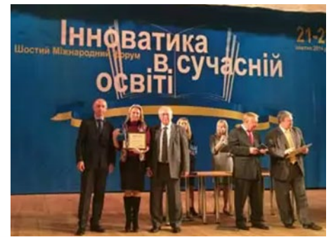
Рис. 31. Вручення диплому лауреата конкурсу II ступеню «Інноватика в сучасній освіті», 2014 р.

За результатами роботи VI Ювілейного Міжнародного медичного форуму «Інноватика в сучасній освіті», який відбувся в жовтні 2014 року навчальний заклад був нагороджений дипломом лауреата II ступеню (рис. 31).