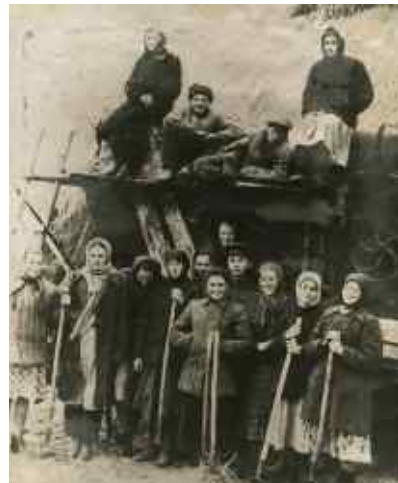
Рис. 16. Студенти на сільгоспроботах

Тож всі студенти школи були вимушені знімати житло в місті. Дуже тяжко доводилось з продуктами харчування. Всі – і студенти, і викладачі отримували так звані хлібні картки. А в листопаді того ж року в школі було відкрито їдальню. Щоб забезпечити її овочами і паливом, студенти влаштовували “недільники” з перебирання картоплі і капусти та розпилювання дров. Для забезпечення школи паливом студенти виїздили до лісу, де кожен повинен був власноруч заготовити 5 кубометрів дров (рис. 16).