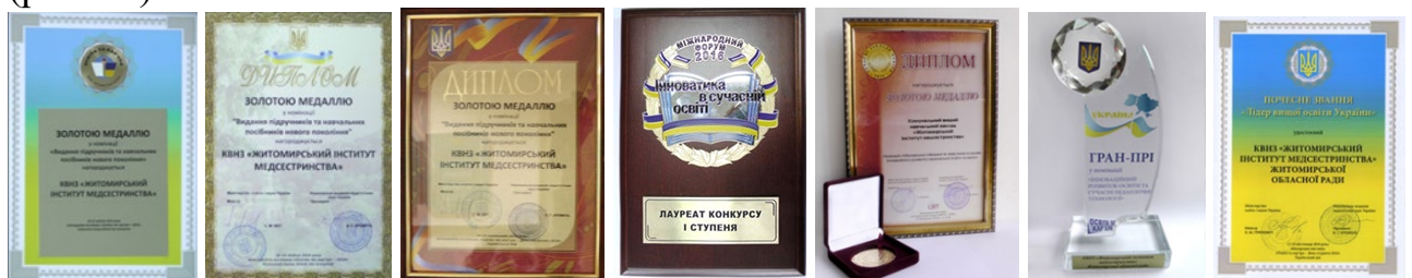
Рис. 32. Житомирський інститут медсестринства - неодноразовий дипломант національних/міжнародних виставок навчальних закладів.

У 2016 році на VII Міжнародній виставці «Сучасні заклади освіти - 2016» заклад нагороджено золотою медаллю та дипломом у номінації «Міжнародна співпраця як невід'ємна складова інноваційного розвитку національної освіти та науки». На VIII Міжнародному форумі «Інноватика у сучасній освіті» інститут отримав диплом лауреата конкурсу I ступеня в номінації «Стандартизація вищої освіти в контексті реалізації інновацій Закону України «Про вищу освіту» та диплом за активну участь в інноваційній освітній діяльності. На VII Міжнародній виставці «Освіта та кар'єра - 2016» Житомирський інститут медсестринства виборов гран-прі у номінації «Інноваційний розвиток освіти» та почесне звання «Лідер вищої освіти України» (рис. 32).