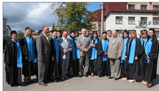
Рис. 29. Студенти першого набору на відділення магістратури Житомирського інституту медсестринства, 1 вересня 2008 р.

У жовтні 2013 року Оргкомітет V Національної виставки-презентації «Інноватика в сучасній освіті», відзначив КВНЗ «Житомирський інститут