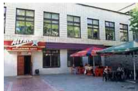
Рис. 27. Літній майданчик МЦ «Альтаір»

У жовтні 2002 року проведено капітальний ремонт і реконструкцію їдальні та прилеглої території, створено єдиний в місті та області серед навчальних закладів Молодіжний центр «Альтаір» (рис. 27).