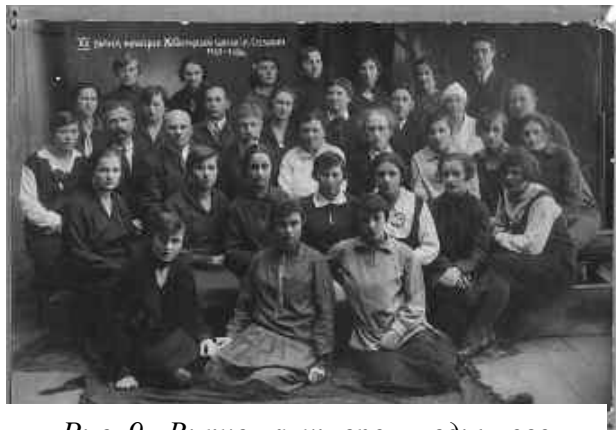
Рис. 9. Випуск акушерок медичного технікуму

Перший випуск медичного технікуму, що відбувся в 1934 р., поповнив ряди середнього медичного персоналу Житомирської округи 57 добре підготовленими спеціалістами – 27 працівниками охмадиту, 18 акушерками, 12 лікпомами.