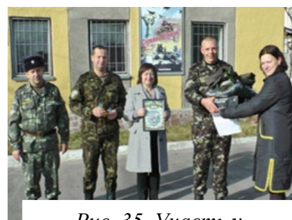
Рис. 35. Участь у благодійній акції по зборі коштів для потреб військовослужбовців

Серед них є чемпіони та призери обласних та Всеукраїнських спартакіад. Студенти Житомирського інституту медсестринства у складі збірної України з