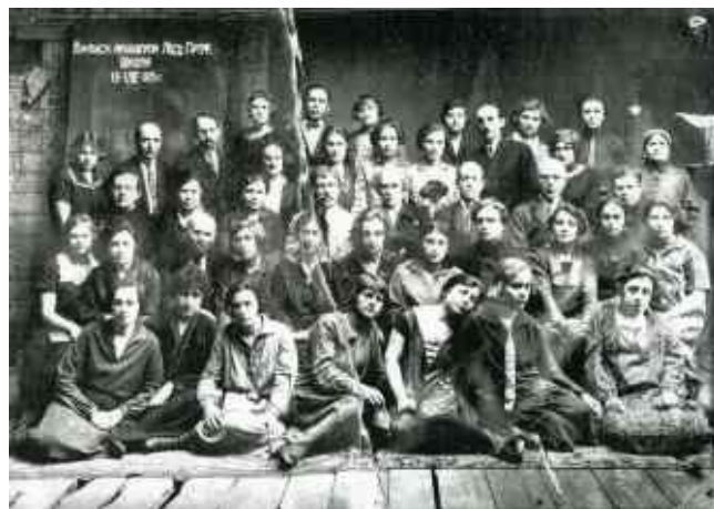
Рис. 8. Випуск акушерок медпрофшколи, 1928 р.

Загалом життя школи в цей період надзвичайно політизоване і ідеологізоване. Велика увага приділялась святкуванню політичних свят – роковин революції, комсомолу, травневих свят, які часто поєднувалися з антирелігійною кампанією (рис. 8).