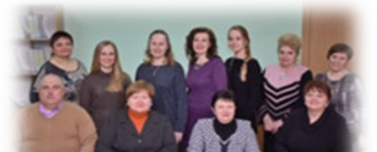
Рис. 30. Колектив кафедри «Лабораторна діагностика» (2019 р.)