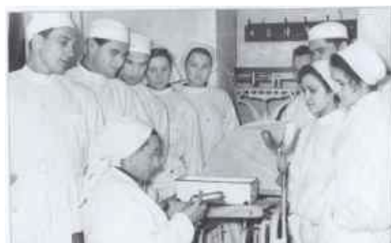
Рис. 20. Практичне заняття з акушерства та гінекології, 1960 р.