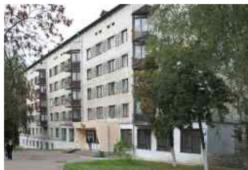
Рис. 22. Гуртожиток училища

Надзвичайно цікавим і змістовним було життя студентів училища. Окрім навчання, вони брали активну участь у будівництві медичних закладів міста – міської дитячої поліклініки, обласної дитячої лікарні. Будівельний загін “Ровесник” працював на будівництві районної лікарні в м. Біла Церква Київської обл., на будівництві санаторію в с. Дениші, кінотеатру “Космос”.