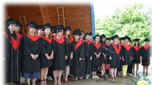
Рис. 33. Випуск магістрів ОПІ 229 «Громадське здоров'я», 2021 р.

На базі інституту проводяться міжнародні, всеукраїнські, регіональні науково-практичні конференції, присвячені актуальним питанням розвитку медичної, медсестринської освіти держави: «Вища освіта і практика в медсестринстві», «Актуальні проблеми лабораторної діагностики», «Актуальні питання підготовки та наукової діяльності магістрів галузі знань «Охорона здоров'я», «Професійні мовні компетенції сучасного фахівця» та інші. За підсумками конференцій видаються збірники. Науковці інституту багато зусиль докладають для створення об'єктів інтелектуальної власності.